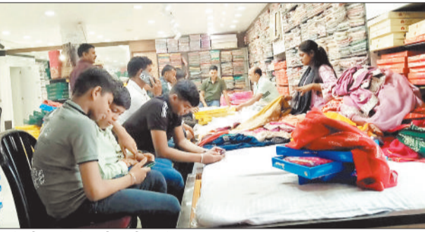
कपड़े की दुकान में खरीददारी करते ग्राहक।