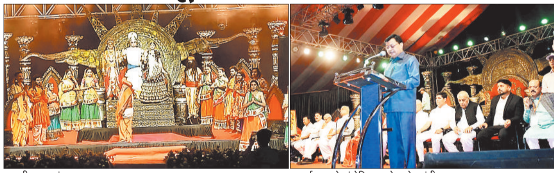
रामलीला का मंचन।