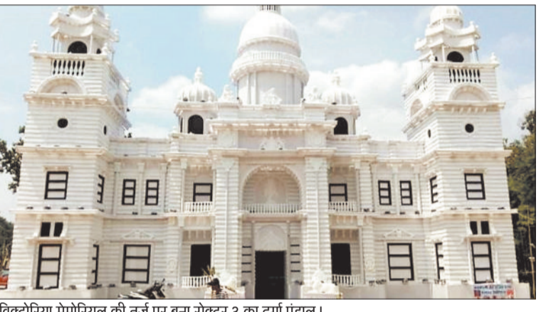
विक्टोरिया मेमोरियल की तर्ज पर बना सेक्टर 3 का दुर्गा पंडाल।