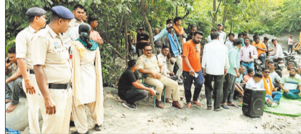
प्रदर्शनकारियों को सम्झाइश देती पुलिस।

सीतामढ़ी गौमाता चौक से उरगा जाने वाले रोड पर राखड़ परिवहन व कोयला परिवहन को लेकर स्थानीय लोगों ने मोर्चा खोल दिया और स्थानीय लोगों ने गौमाता चौक में प्रदर्शन कर जमकर नारेबाजी की और प्रशासन का ध्यान आकर्षण कराया। स्थानीय लोगों ने अपने विभिन्न मांगों को लेकर जिला प्रशासन और पुलिस को ज्ञापन सौंपा है यदि जल्द ही उनकी मांग पूरी नहीं हुई तो आने वाले दिनों में उन्होंने उग्र आंदोलन करने की चेतावनी दी है।