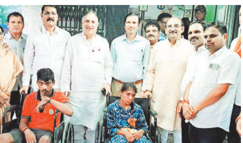
दिव्यांगों को उपकरण वितरित करते हुए अतिथि।

सेवा पखवाड़ा 17 सितंबर से 2 अक्टूबर तक चलने वाले विभिन्न कार्यक्रमों के अंतर्गत छग निशवतजन वित्त एवं विकास निगम के अध्यक्ष लोकेश कांवड़िया अपने एक दिवसीय कोरबा दौर में रहें। इस अवसर पर उन्होंने सेवा पखवाड़ा के तहत दिव्यांग जनों को उपकरण वितरण किया तथा निगम से श्रेण लेकर