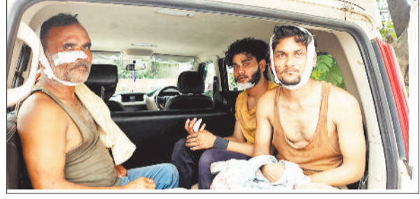
मारपीट के आरोपी।