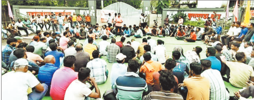
प्रदर्शन करते टेका कामगार।

और सुबह 9 बजे से एसईसीएल के मुख्य कार्यालय के सामने शांतिपूर्ण धरना प्रदर्शन शुरू किया। इस सफल आंदोलन के परिणाम स्वरूप एसईसीएल प्रबंधन के अधिकारियों के साथ कई दौर की वार्ता हुई। वार्ता के बाद यह निर्णय लिया गया कि सभी टेका कामगारों को बोनस और वेतन भुगतान उनके खाते में 8 और 15 अक्टूबर तक जमा कर दिया जाएगा। प्रबंधन इस संबंध में जल्द ही ऑफिस ऑर्डर जारी करेगा और सूचना पोर्टल पर भी प्रदर्शित करेगा। भविष्य को ध्यान