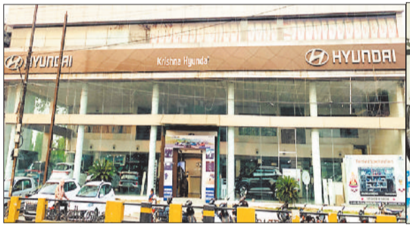
कृष्णा हुडई शोरूम।