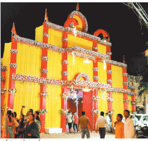
दुर्गा पंडाल के सामने एकत्र जनसमूह।