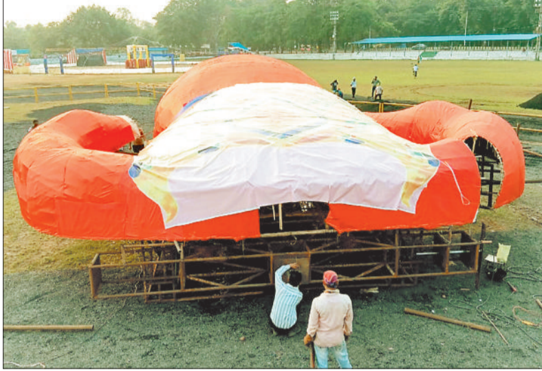
लाल मैदान में रावण का पुतला तैयार करते हुए।