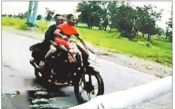
सीसीटीवी फुटेज में बाइक चालक।