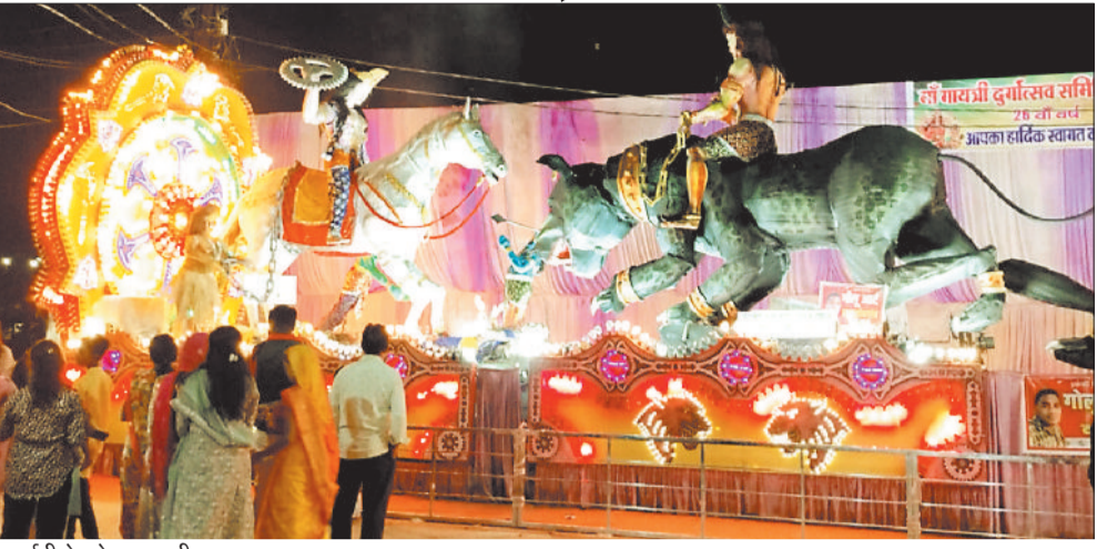
प्रदर्शनी देखते नगरवासी।