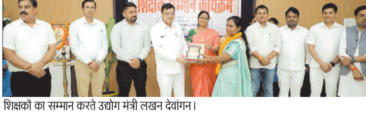
शिक्षकों का सम्मान करते उद्योग मंत्री लखन देवांगन।