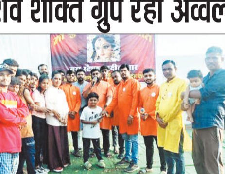
प्रतियोगिता में विजयी टीम।

यह पंडाल श्रद्धा और कला का अद्भुत संगम बना। दुर्गा पंडाल की आकर्षक सजावट और देवी के मनमोहक दर्शन के लिए बड़ी संख्या में बालकोनगर और आसपास के क्षेत्रों से श्रद्धालु पहुंचे। सेक्टर-3 में आयोजित यह सार्वजनिक दुर्गा पूजा बालकोनगर की सांस्कृतिक और आध्यात्मिक पहचान बन चुकी है। इस वर्ष यह आयोजन अपनी गौरवशाली परंपरा के 55वें वर्ष में प्रवेश कर रहा है।